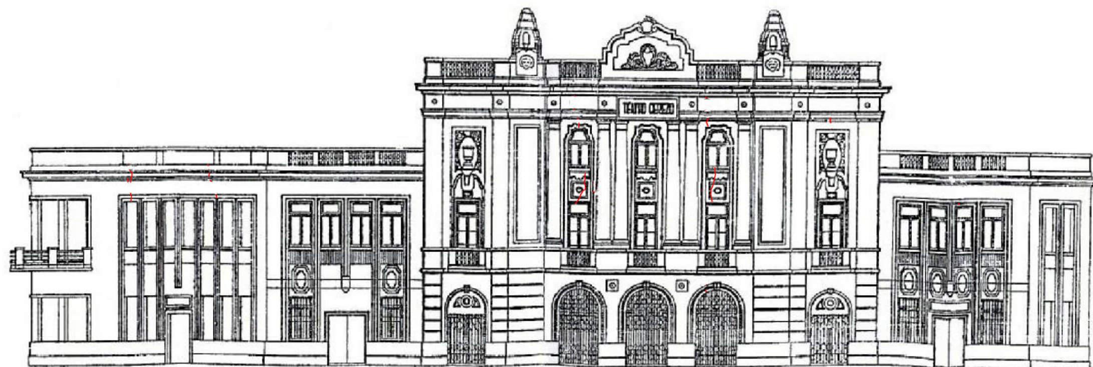
ALZADO A PASEO DEL ESTATUTO